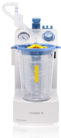
Vario 18 suggpump