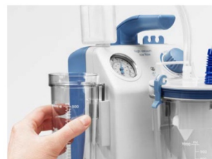
Kan anpassas efter individuella behov

Vario 18 erbjuder enkel, intuitiv hantering. Alla tillbehör är utformade för att komplettera den på ett perfekt sätt och för att motverka felaktiga anslutningar. Bland de valbara tillbehören finns till exempel en vagn, en bärväska och flera olika delar. Pumpen har även en inbyggd batteriladdare som gör den möjlig att bära med sig. Särskilda batterialarm anger med ljud- och ljussignaler när batteriet behöver laddas.