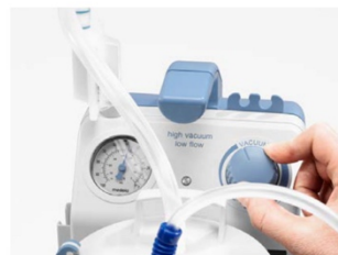
Exakt vakuuminställning med intryckningsbart vred

Det innovativa kolv/cylindersystemet i fyra lager, QuatroFlex, bygger upp ett vakuum på några sekunder. Pumpen har kompakt storlek och låg ljudnivå under drift. Förutom den unika utformningen och tekniken är Vario 18 lätt att serva och underhålla – något som värderas högt av medicintekniker. Membranvakuumregulatorn möjliggör exakt vakuuminställning. Vredet måste tryckas in när vakuumnivån ska ändras, vilket förhindrar oavsiktliga inställningsändringar. Medela Vario 18 kan därför användas vid patientens säng.