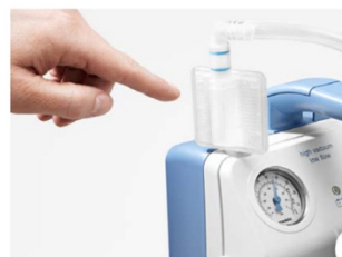
Optimal hygien för många användningsområden

Vario 18 har låg vikt och är bärbar, vilket gör att den kan användas på olika avdelningar i sjukhus och på kliniker samt i hemmiljö. Den kan användas vid såväl små kirurgiska ingrepp som för luftvägssugning. Med vakuumregulatorn är det enkelt att ställa in olika sugnivåer. Vario 18 kan förses med antingen ett engångs- eller ett flergångssystem för uppsamling av vätska.