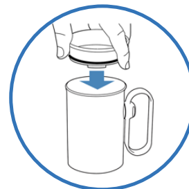
Lock med dricköppning ingår