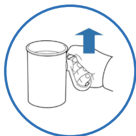
Håller sig upprätt