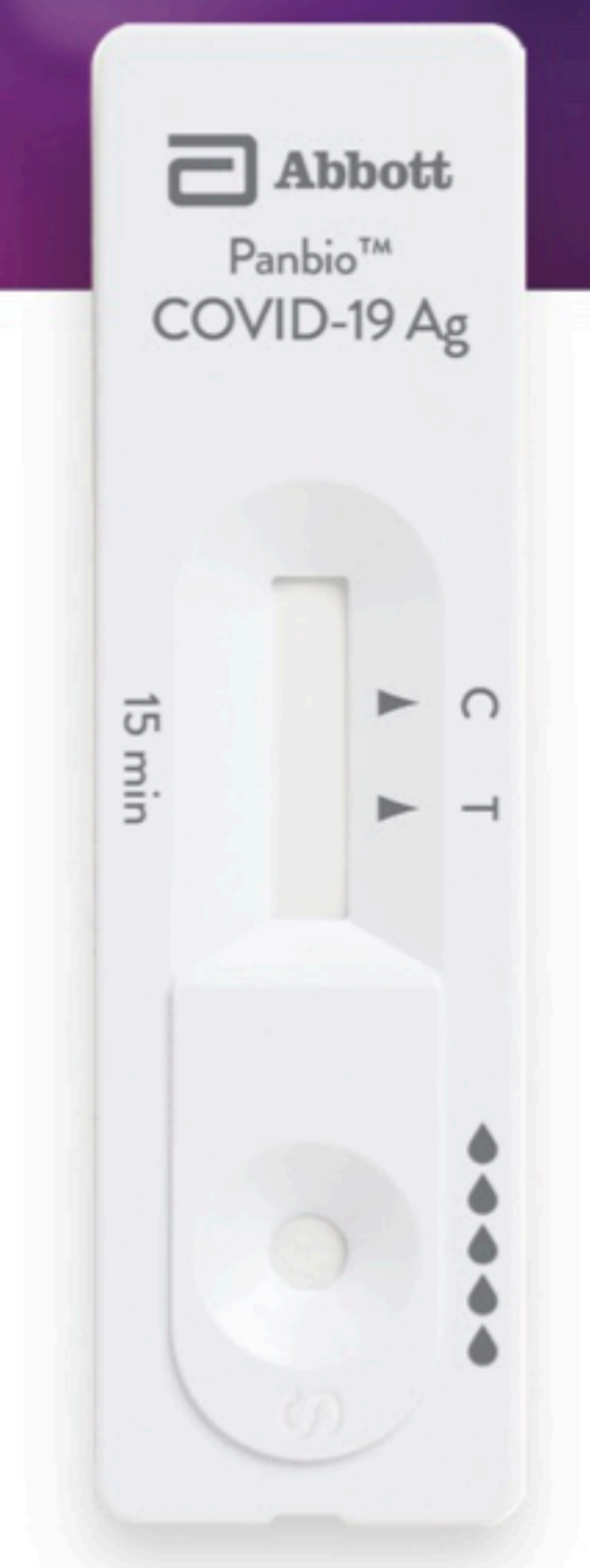
Panbio™ COVID-19 Ag Rapid Test Device